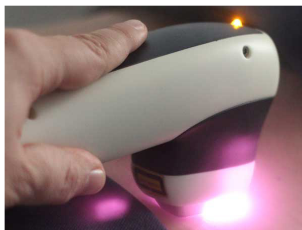
Das Epilations-Handstück des Asclepion MeDioStar NeXT Laser mit integriertem Peltier-Kühlelement

Im Handstück unseres Hochleistungs-Lasers sind mehrere Lasereinheiten (800 und 950 nm) integriert, die parallel Energie abgeben. Der Behandlungserfolg lässt sich an einer leichten Rötung (perifollikuläres Erythem) oder Schwellung (Ödem) des Haarfollikels ablesen.